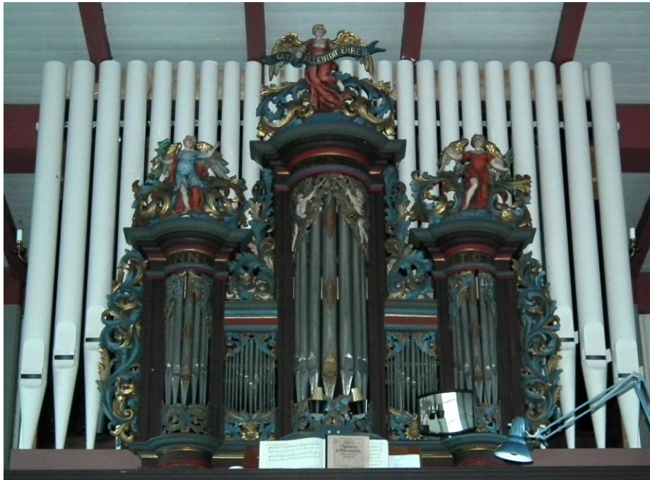
Orgelet i Vestvik kirke, Framverran.