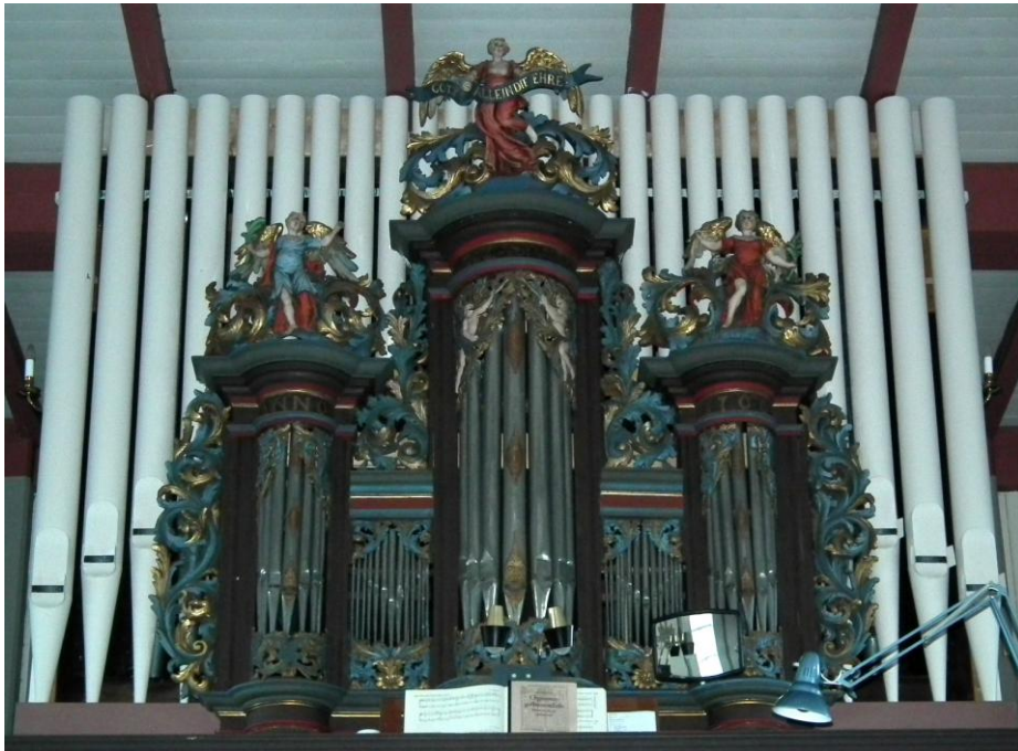
Orgelet i Vestvik kirke, Framverran.