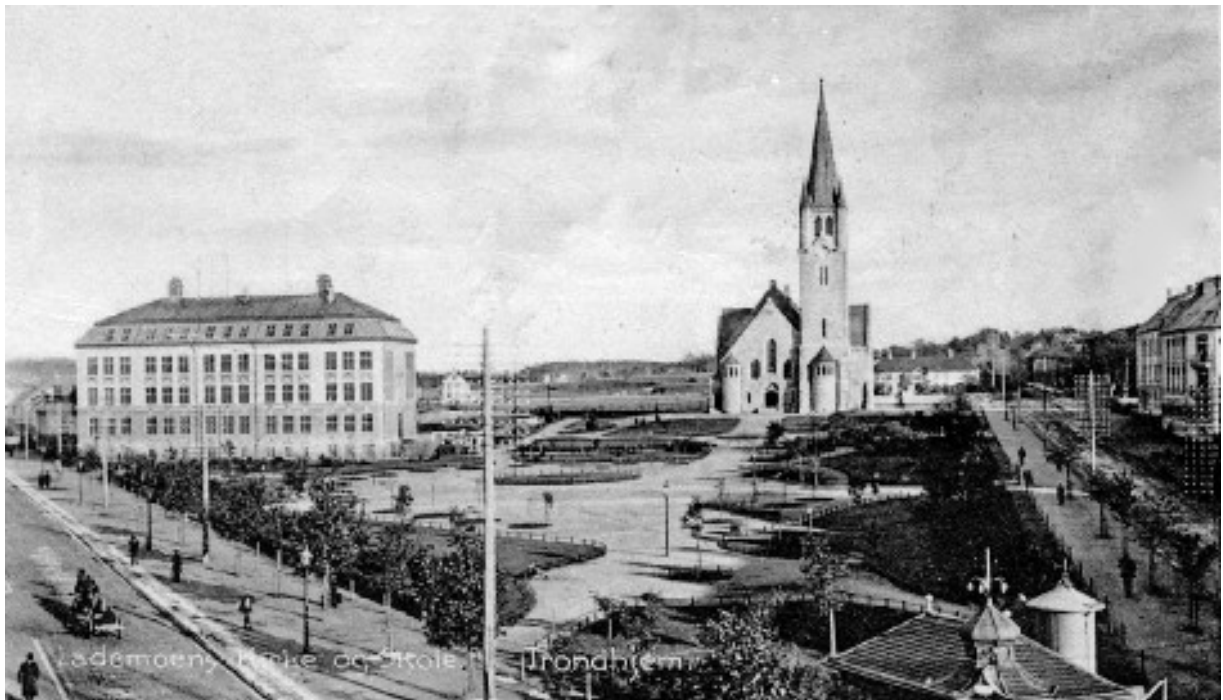
Postkort fra Lademoparken - 1912.