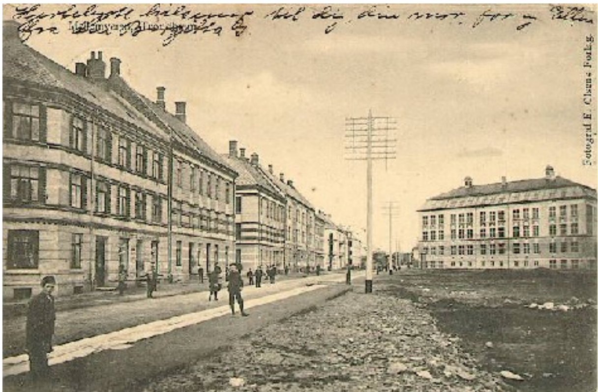
Postkort fra Mellomveien.