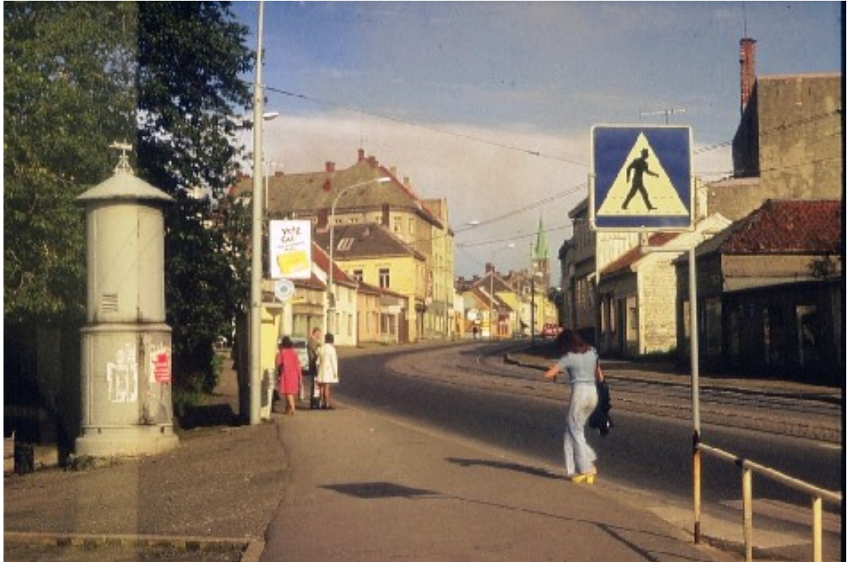
Innherredsveien fra 1972.