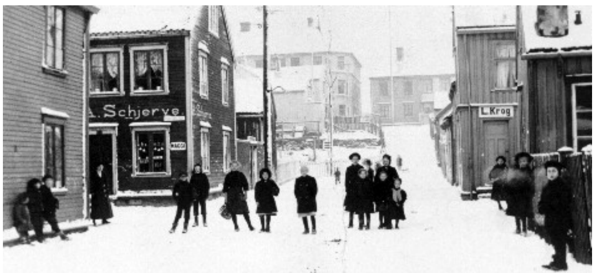
Nerlamon med butikkene til Schjerve og Krog.