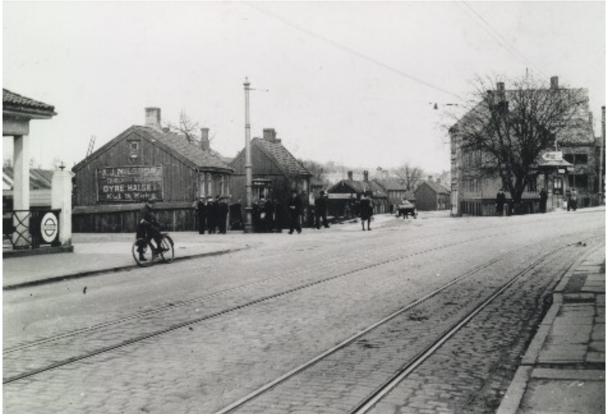
Krysset Innherredsveien/Strandveien 1945.