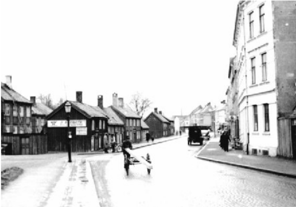
Strandveien med brustein og gasslykt på '50-tallet.