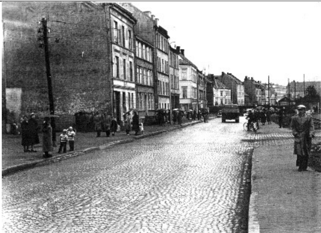
Strandveien 1958. Folk venter på at kong Olav skal kjøre gjennom.