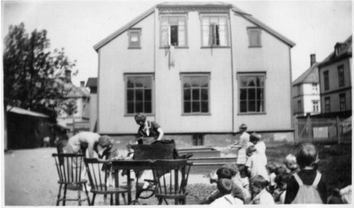
Asylet barnehave fra 1932.