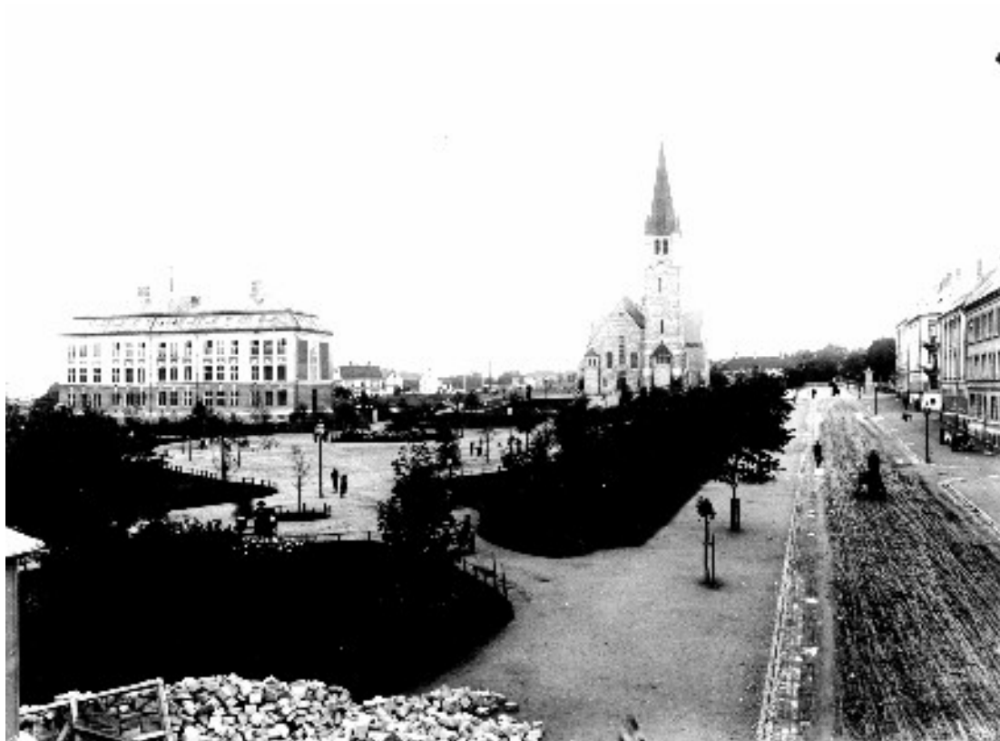
Like før Innherredsveien og Mellomveien får fast dekke i 1920, og dermed forlengelse av trikkelinjen i første omgang via Jon Raudes gate.