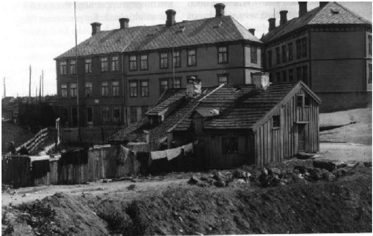
Strandveien rett sør for Merakerbanen, nr. 19 – 21 i bakgrunnen.