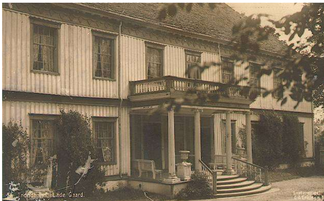
Lademoen som område nevnes først rundt slutten av 1700-årene i Strinda kommunes historie. Lademoen tilhørte i

Hvordan kan man tenke seg hvordan Nerlamon så ut i middelalderen fram til 1700-årene? Hvorfor betegnes område Lade for Hlade i gamle skrifter, og påfølgende Hlademoen? Denne skriveform holdt seg helt opp til våre dager, i begynnelsen av forrige århundre. Var det noe bosetning der i denne tidsperiode? Var det noen form for bosetning i vikingtiden? Hvorfor nevnes østsiden av Nidelven bare med kongssete Hlade, av Snorre Sturlason? Slike og mange andre spørsmål dukker opp som en selvfølge når Lademoen og Nerlamons historie skal nedtegnes. Hlade, og Hlade gård beskriver Snorre S. i Kringla Heimsins som et sete for Hladejarlene og et kongsete. Hvis dette har sin riktighet måtte Hlade med Hlademoen vært bebodd i denne tiden av mennesker med vanlig byrd, da både konger og jarler hadde en stående hær omkring seg i tillegg til sin hird.